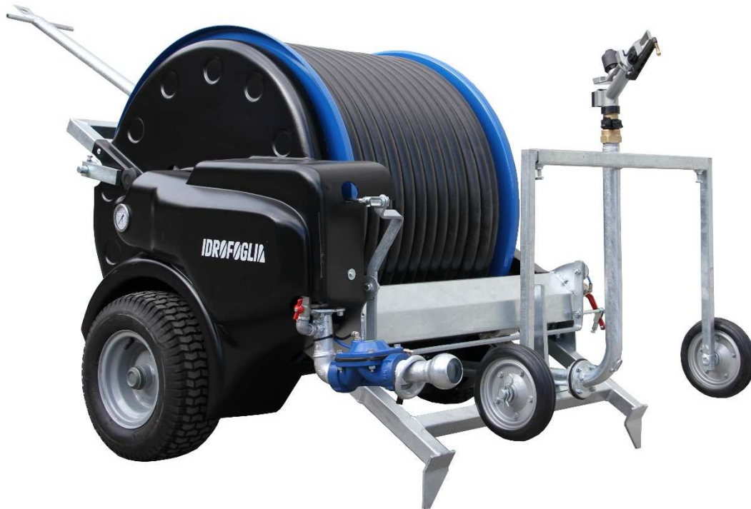
Immagine a scopo dimostrativo; il modello illustrato potrebbe non corrispondere a quello realmente fornito